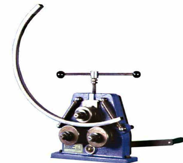
BS 40 mit Handkurbel